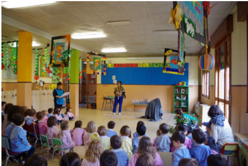
In salone le maestre hanno drammatizzato la Parabola ai bambini.